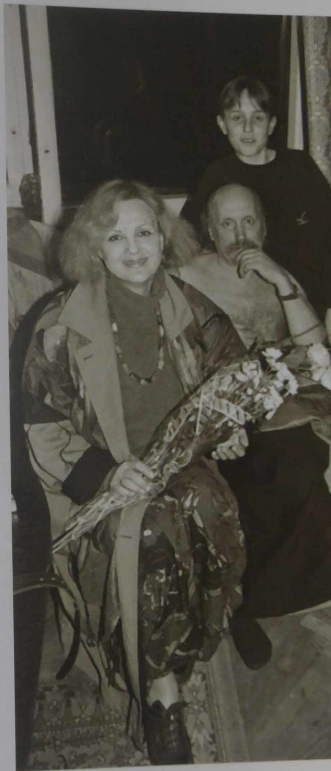
После концерта. 1996 г.

Но все же появилась возможность при помощи фирмы «Philips» в 1994 году записать диск на одной из престижных студий в Голландии — «Wisseloord Studios». Должна сказать, что она — из тех студий, дверь которой могут открыть только первые лица мирового музыкального бомонда. К тому же с финансированием достаточно высокого уровня. Кстати, студия расположена рядом с городом в красивейшем местечке, где сказочная природа и всегда слышна музыка. Здесь записывали свои диски звезды мировой величины — в частности, Элтон Джон и Мик Джаггер. Вот и Володе тоже посчастливилось там записываться. Именно благодаря тому самому первому и единственному «золотому диску».