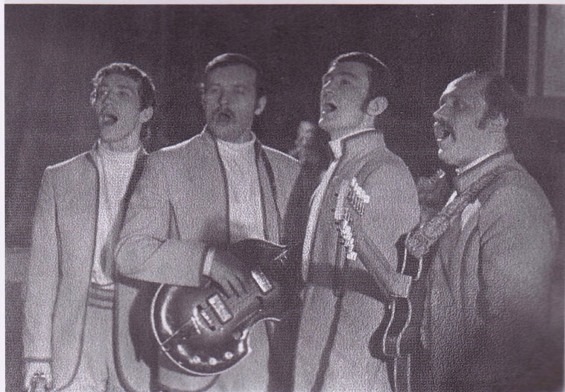
Барткевіч, Тышка, Місевіч, Мулявін. 1971 год