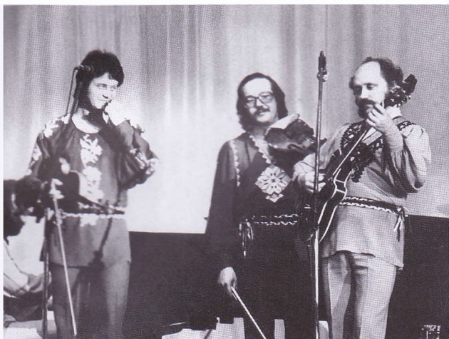
Дайнека, Паплаўскі, У. Мулявін. 1982—1984 гг.