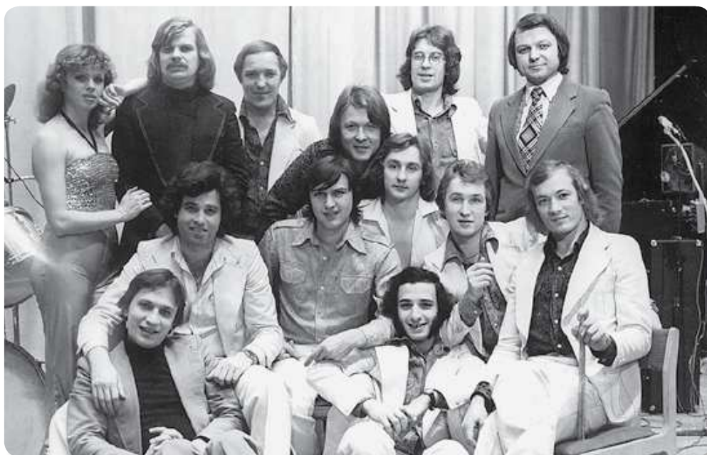
ВИА «Самоцветы». 1983 год

Меня радует, что сегодня у исполнителя есть много возможностей, есть индивидуальная подготовка. Фантазия человека свободна, и он имеет огромный потенциал для создания, как сейчас называется, творческого имиджа, то есть выявления индивидуальности через внешность, поведение, детали туалета. Хорошо бы еще и репертуар разнообразить, а не тянуть всем одну мелодию с разными, но одинаково бессмысленными текстами. Я думаю нужно пройти своеобразный этап вакуума, чтобы люди поняли, что талант — дар Божий — во многом определяется и формируется внутренним содержанием самого человека.