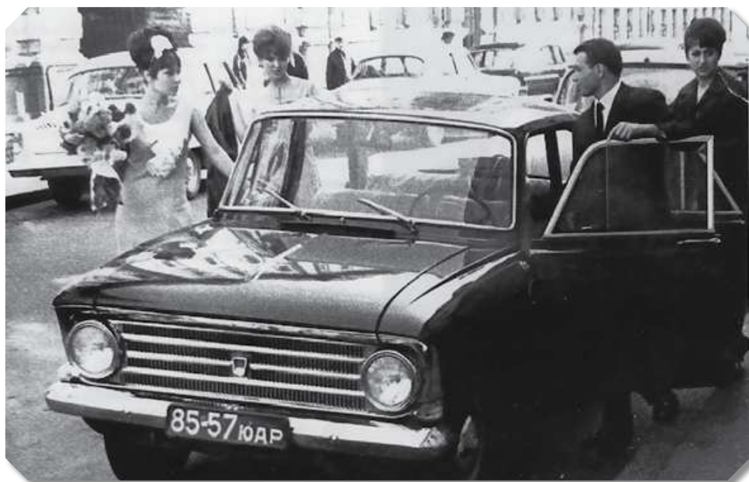
Подготовка к свадьбе. 1966 год