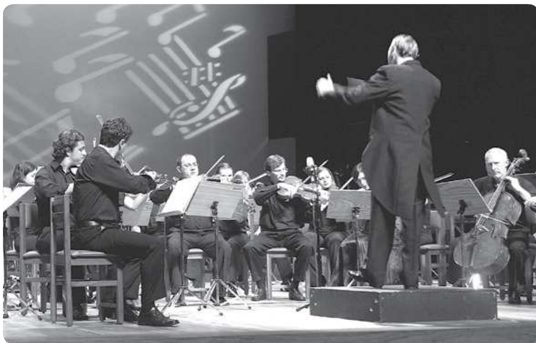
Выступление симфонического оркестра

В 1961 году мы приняли участие в первом Московском джазовом фестивале и стали его лауреатами. В это же время меня пригласили работать в «Москонцерт» в качестве аккомпаниатора певцу на профессиональной эстраде. Мне выдали удостоверение, подтверждающее мою должность артиста оркестра «Москонцерта», и установили оклад в 156 рублей. Итак, в 61-м году мне было 18 лет, я уже имел определенный статус на эстраде и большой оклад — это стало для меня свершением чуда, хорошим стартом в высокое