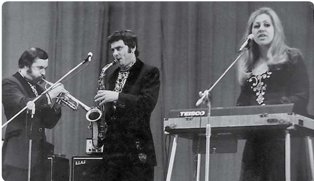
Фрагмент концерта. 1973 год

С самого начала я совершенно точно знал, каким он должен быть — ансамбль моей мечты. Может быть, я опять повторяюсь, но рука сама пишет эти строки. Я хотел, чтобы