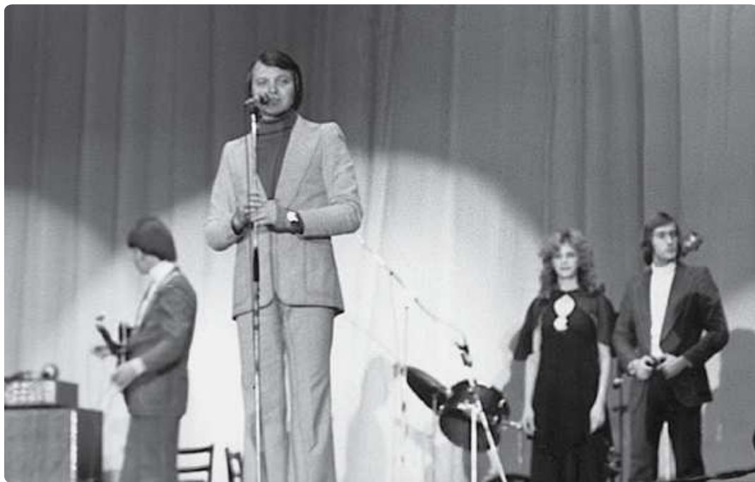
На творческой встрече со зрителями. 1980 год