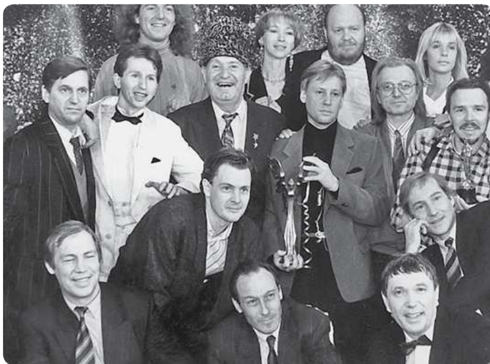
На телевизионной съемке программы «Под знаком зодиака». 1993 год